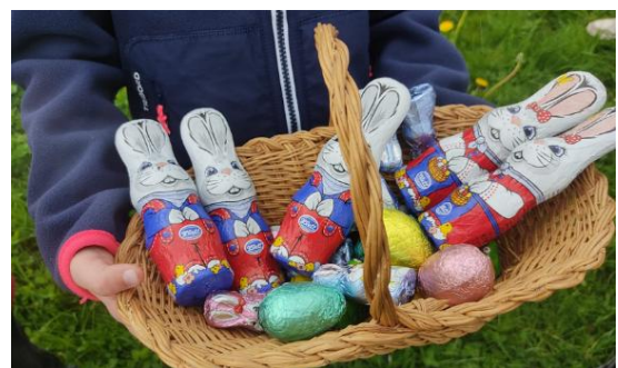
21 avril 2025 « Chasse à l'oeuf »