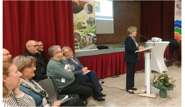
11 janvier 2025 « Cérémonie des vœux 2025 »