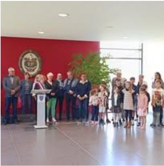
8 mai 2025 : Commémoration du 8 mai 1945