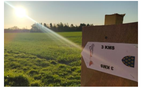
6 avril 2025 « 3 e édition du Parcours du Cœur - 520€ de dons récoltés – Merci à tous ! »