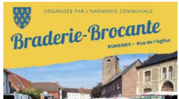
15 juin : Braderie-brocante de l'Harmonie