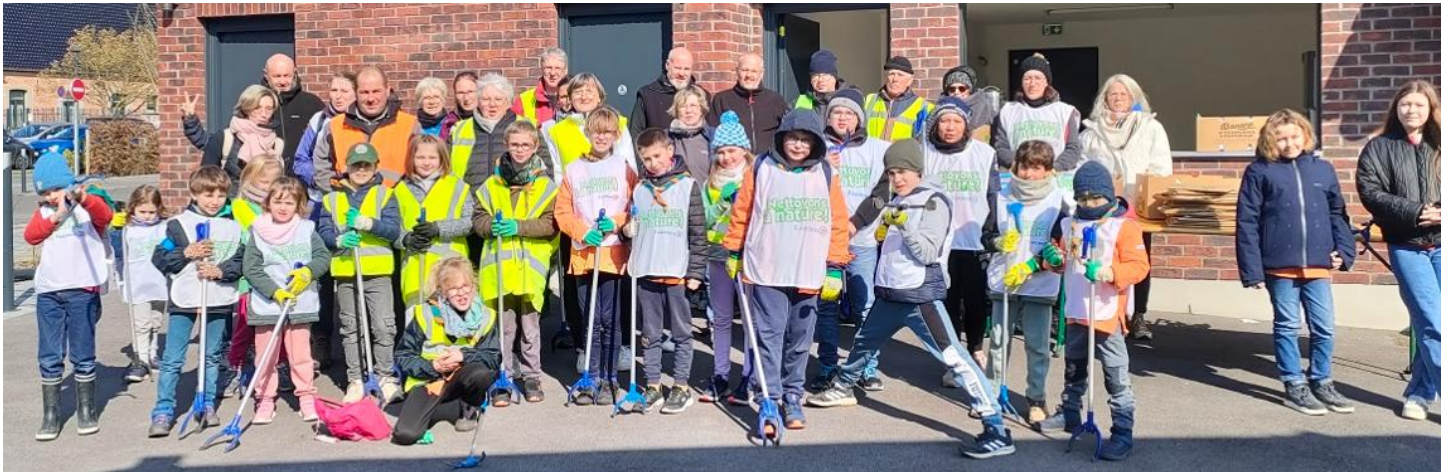
15 mars 2025 « Opération Village propre »