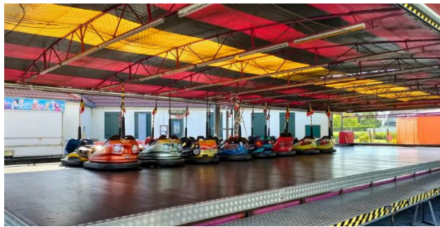
7, 8 et 9 juin : Ducasse