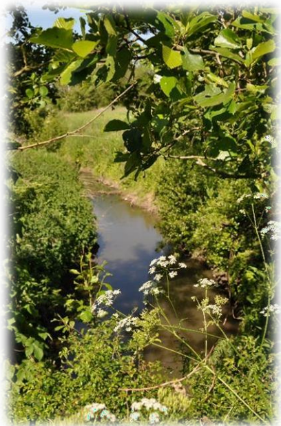
L'Elnon au lieu-dit « La Planche de l'Elnon »